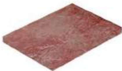
MECHANICALLY DEBONED CHICKEN MEAT