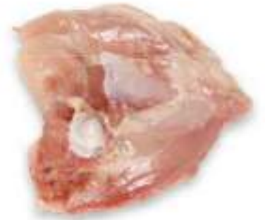
CHICKEN UPPER THIGH WITH SKIN