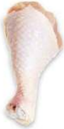
CHICKEN DRUMSTICK WITH SKIN