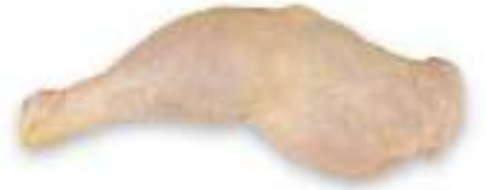
CHICKEN ANATOMIC LEG