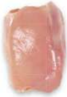
CHICKEN BONELESS THIGH WITHOUT SKIN