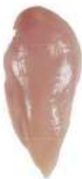
CHICKEN FILLET HALVES WITHOUT INNER FILLET