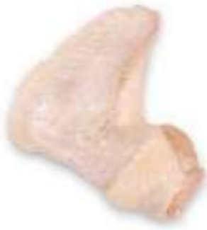
CHICKEN 2 JOINT WINGS