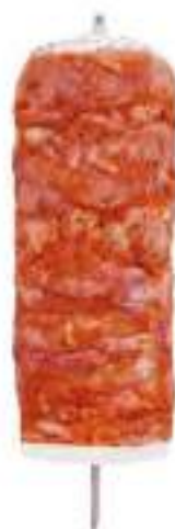
FROZEN CHICKEN DONER KEBAB