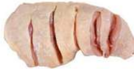
CHICKEN SLICED ANATOMIC LEG