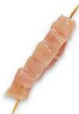
CHICKEN BREAST SHISH