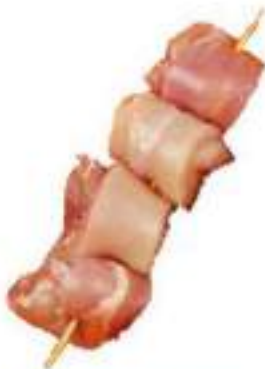
CHICKEN THIGH SHISH

لحم فخذ دجاج منزوع الجلد والعظم لعمل السموتيه