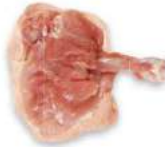
CHICKEN THIGH RIB WITH SKIN