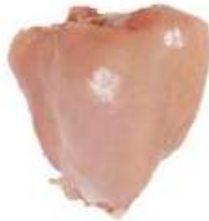
CHICKEN DRUMS WITHOUT SKIN