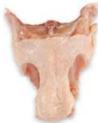
CHICKEN UPPER BACK