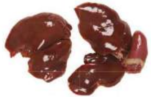
CHICKEN LIVER AND HEART