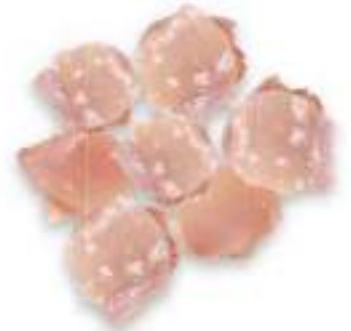
CHICKEN BONELESS THIGH CUTS WITHOUT SKIN

لحم فخذ دجاج منزوع الجلد والعظم لعمل السموتيه