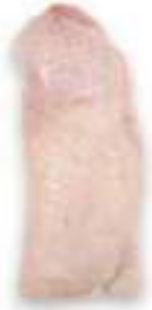
CHICKEN BONELESS ANATOMIC LEG