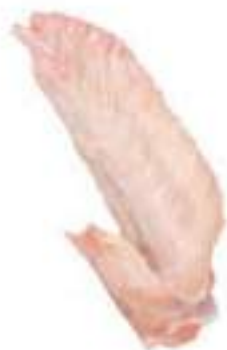
CHICKEN WING TIP