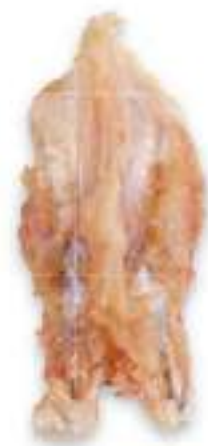
CHICKEN BREAST CUP BONE