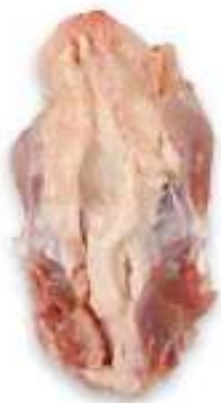
CHICKEN LOWER BACK