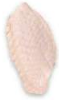
CHICKEN WING MID-JOINT