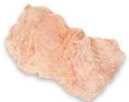
CHICKEN BREAST SKIN