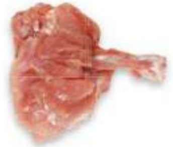
CHICKEN THIGH RIB WITHOUT SKIN