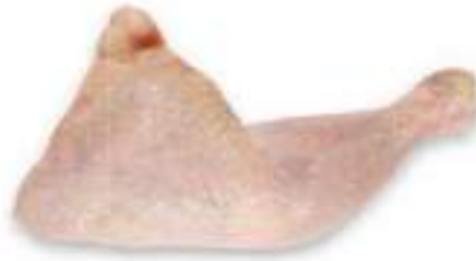
CHICKEN LEG QUARTER