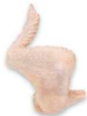
CHICKEN 3-JOINT WINGS