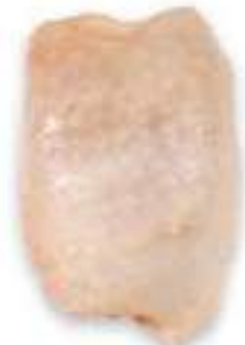
CHICKEN BONELESS THIGH WITH SKIN