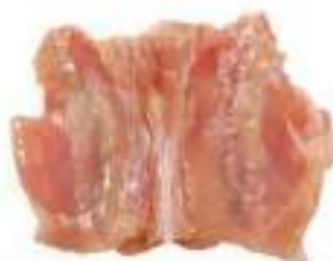
CHICKEN BACK BONE MEAT