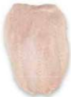
CHICKEN FILLET WITH SKIN