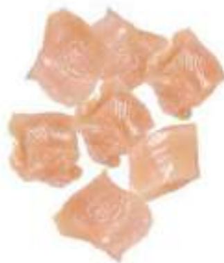
CHICKEN BREAST MEAT CUTS