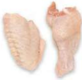
SPECIAL WINGS FOR GRILL