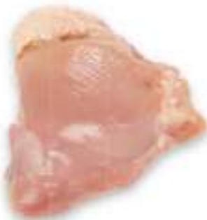
CHICKEN THIGH WITHOUT SKIN