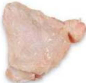
CHICKEN THIGH WITH BACK ATTACHED