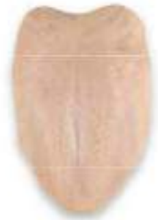
CHICKEN BREAST WITHOUT BACK