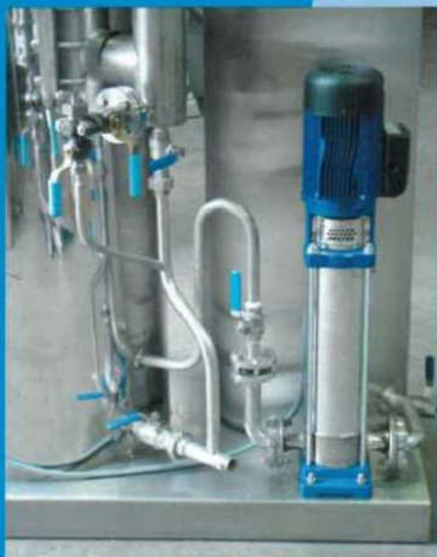
2 - particolare pompa in acciaio inox/stainless steel pump unit