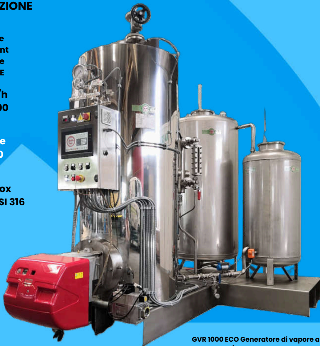
GVR 1000 ECO Generatore di vapore a gas 1000 Kg/h con PLC, vasca di blow- down ed economizzatore