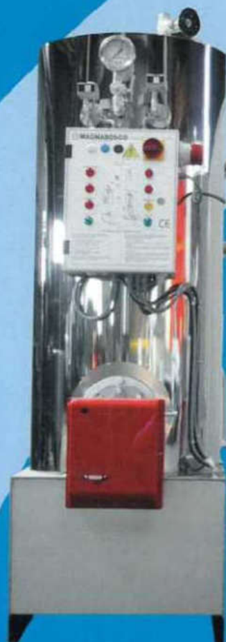
GVR "C" 300

CERTIFICATO N. 852-004/2021 UNI EN ISO 9001:2015