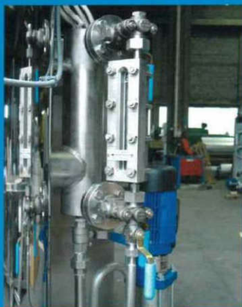
1 - particolare gruppo di livello in acciaio inox / stainless steel level unit