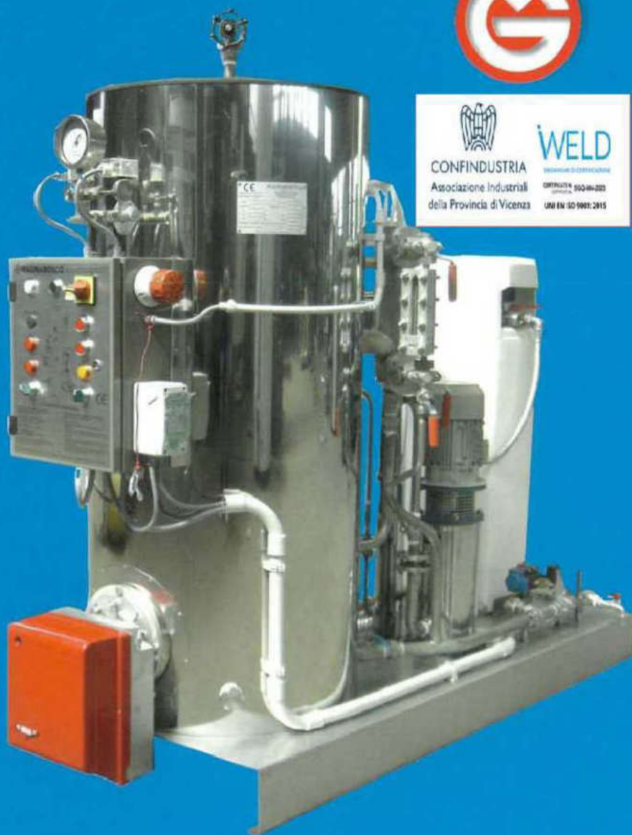
GVR 650 in AISI 316L con Economizzatore GVR 650 in AISI 316L with Economizer